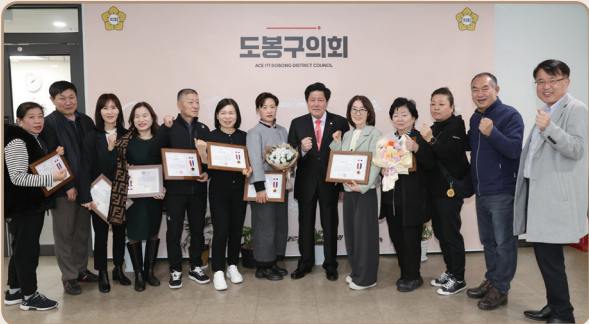
도봉구의회 의장 표창 수여식 2026.3.19.