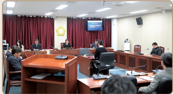
제350회 임시회 폐회중 운영위원회 2026.3.25.